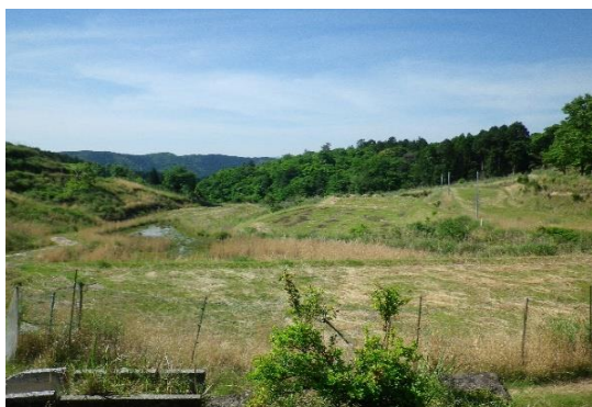
間取り図(現況優先)