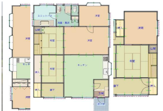
間取り図(現況優先)